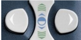
TI-84 Plus T