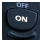
TI-84 Plus T